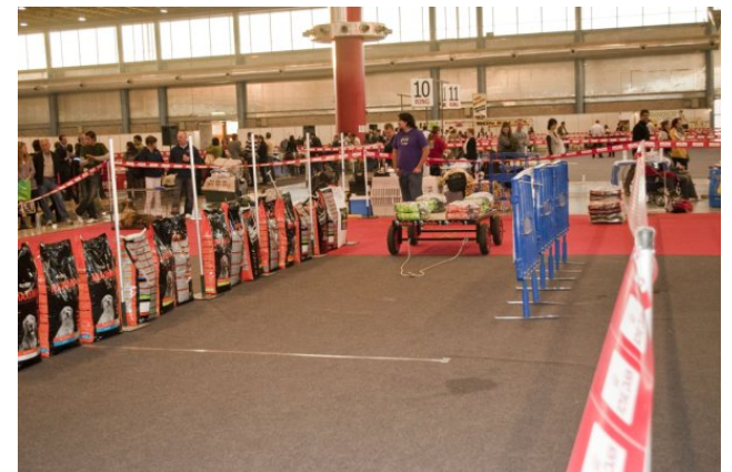
Detalle de la pista de trabajo en Alicante